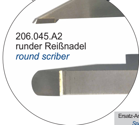
206.045.A2 runder Reißnadel round scribe