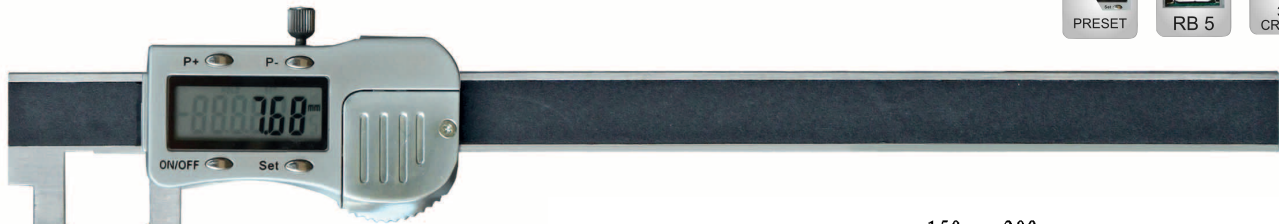
240.207.O - 240.209.O